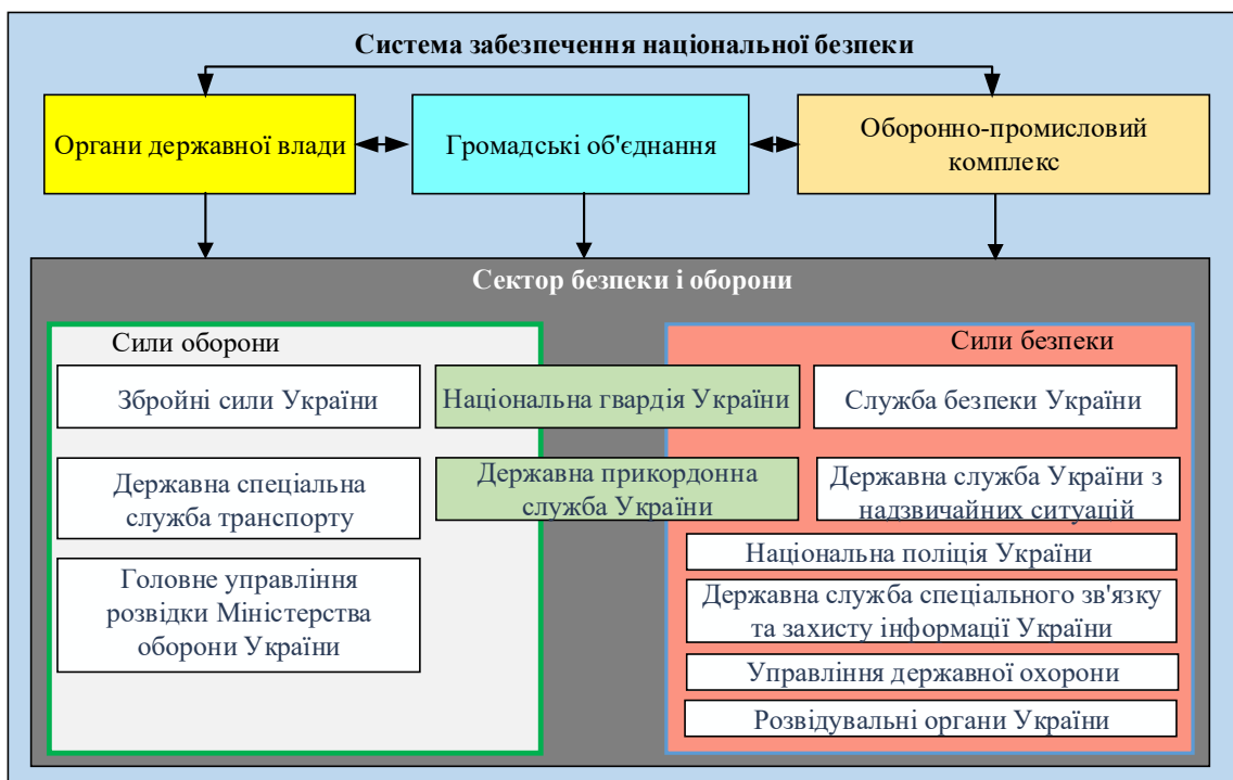
Рис. 2. Структурна схема системи забезпечення національної безпеки (розробка автора)

Основними силами, які залучаються до дій у період більшості кризових ситуацій мирного часу, що загрожують державній безпеці, є Служба безпеки України та сили безпеки на чолі із Міністерством внутрішніх справ України (Національна поліція України, Національна гвардія України, Державна служба з надзвичайних ситуацій, Державна прикордонна служба України).